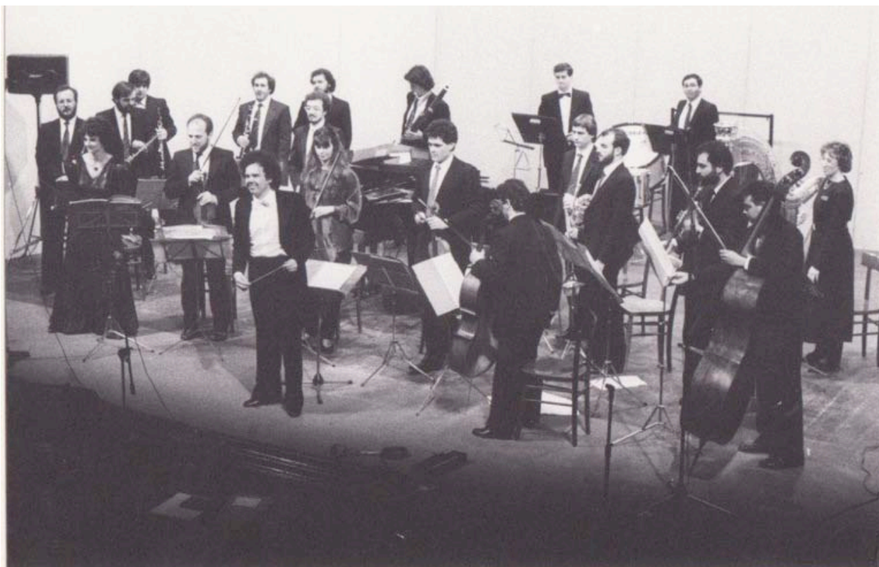
Lucca, XXV stagione AML – 1989 (musiche di Gaetano Gianni-Luporini)

Contemporaneamente al suo percorso nelle sale da concerto, il Gruppo – sotto la direzione di Fabio Neri – si è mosso in ambiti promozionali e divulgativi della musica contemporanea, ha commissionato nuove opere a giovani compositori, ha tenuto seminari e corsi in tutto il mondo diffondendo le nuove tendenze musicali italiane. Ha registrato per la Rai, Orf, la ZDF, la Radio brasiliana e Radio NBC di Melbourne. Di grande prestigio le tournées che hanno toccato Jugoslavia, Cecoslovacchia, Grecia, Brasile, Australia, Germania ed Austria, durante le quali sono state tenute master-class sulla musica italiana del nostro tempo. Il Gruppo ha collaborato con i più autorevoli compositori italiani, Goffredo Petrassi, Franco Donatoni, Salvatore Sciarrino, Luciano Berio ed altri ancora, spesso presenti in sala durante i concerti monografici a loro dedicati, nonché con artisti come Emanuele Luzzati.