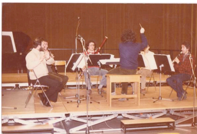
Il quintetto a fiato del Gruppo Maderna (Innsbruck 1984)