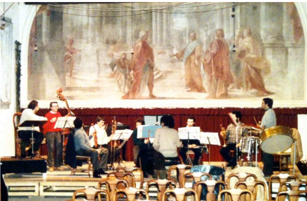
Lucca 1985 – Prova dell' Histoire du soldat di Stravinsky